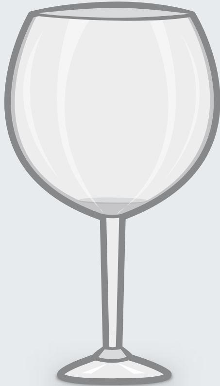
Rotweinglas (60 cl)