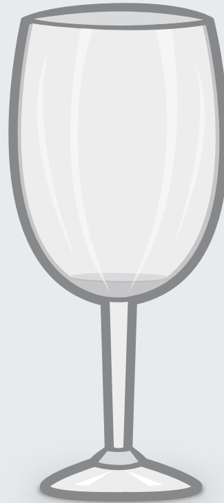
Weißweinglas (30 cl)

Natürlich für Weißwein oder auch für Weißweinschorle