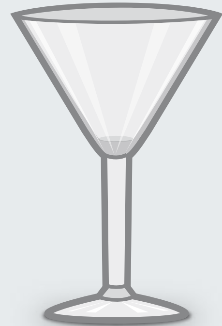
Cocktailshale (12 bis 25 cl)

Die große Version des Tumblers. Für Cocktails und Longdrinks.